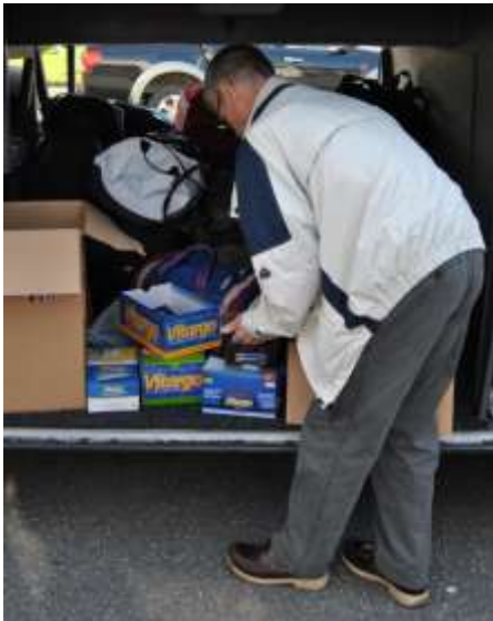
Bosse letar fram det "vita pulvret"