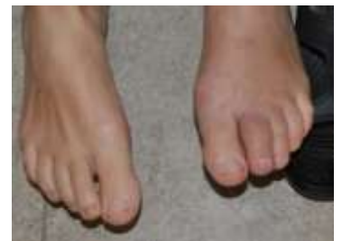
Kattas onda tå