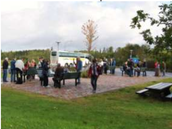
Fika och kisspaus