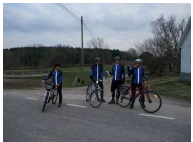
Banläggning på fredagskvällen